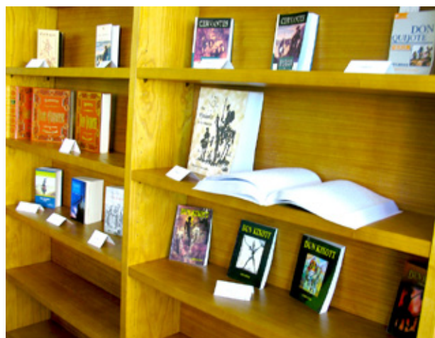
Colección de libros de Cerrillo I