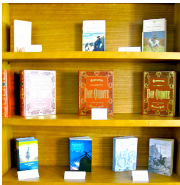
Colección de libros de Cerrillo II

de nuestro PCPI de Artes Gráficas en la que aparecían los centros europeos participantes en el proyecto Grundtvig y que llevaríamos de regalo para los participantes al congreso de Rumanía en abril de 2011 acompañando a la presentación de la actividad.