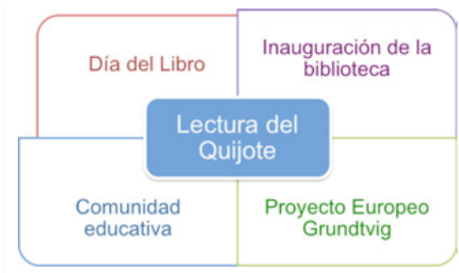
■ Gráfico 1: Lluvia de ideas

Se entusiasmaron tanto con la idea que enseguida empezaron a fluir nuevas aportaciones. Íbamos apuntando todo y el viaje se nos pasó volando. Las propuestas aparecían encadenadas unas a otras y así cobró forma lo que parecía una simple ocurrencia. De esta manera tan inusual pusimos en pie esta creativa experiencia.